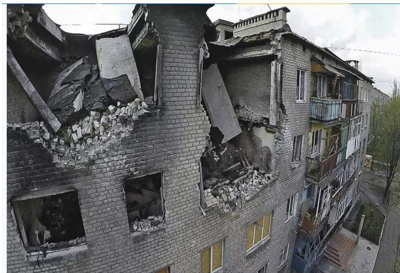
Не было возможности осознать ужас происходящего - новые трагедии заслоняли уже прошедшие...