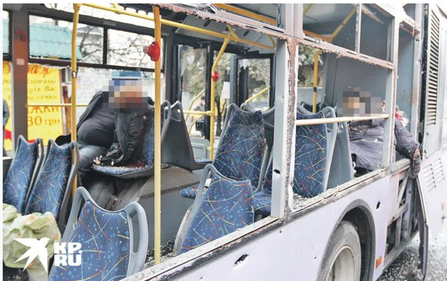
Жертвы украинского артобстрела остановки общественного транспорта в Ленинском районе Донецка